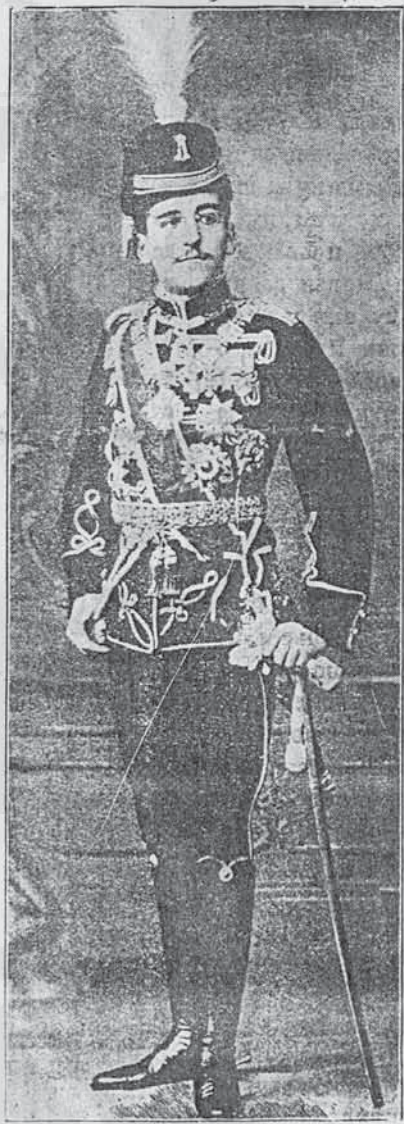
ВЕЛИЧАЊСТВО КРАЈ СРБИЈЕ ПЕТАР I.