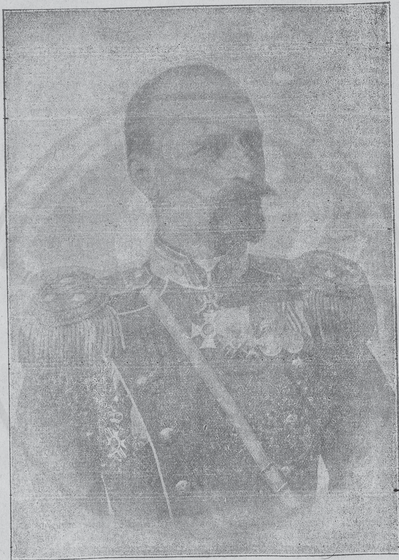
Запасенъ Генералъ Иванъ Цончевъ.

Роденъ въ гр. Дръново на 1860 г. Въ руско-турската война е взелъ участие като опълченецъ.— Въ сръбско-българската война е командувалъ дружина и е показалъ чудесна храбростъ. — Раненъ е билъ въ гърдите. Обичанъ и почитанъ отъ младото българско офицерство като баща.