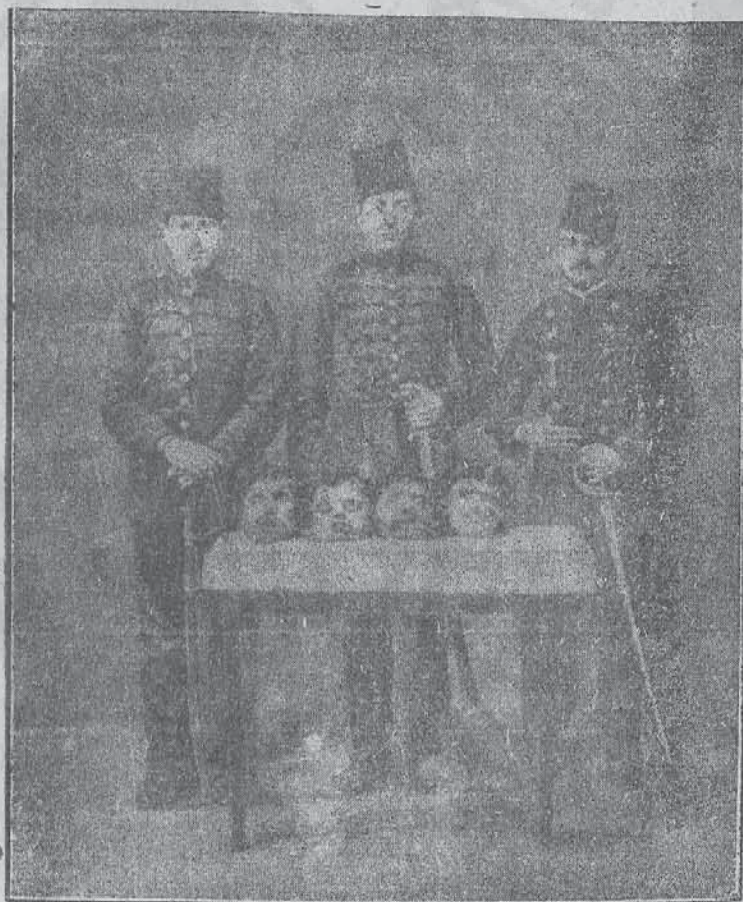
(Турскитѣ агенти и тѣхнитѣ жертви)